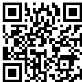
【学運交サイト QRコード】